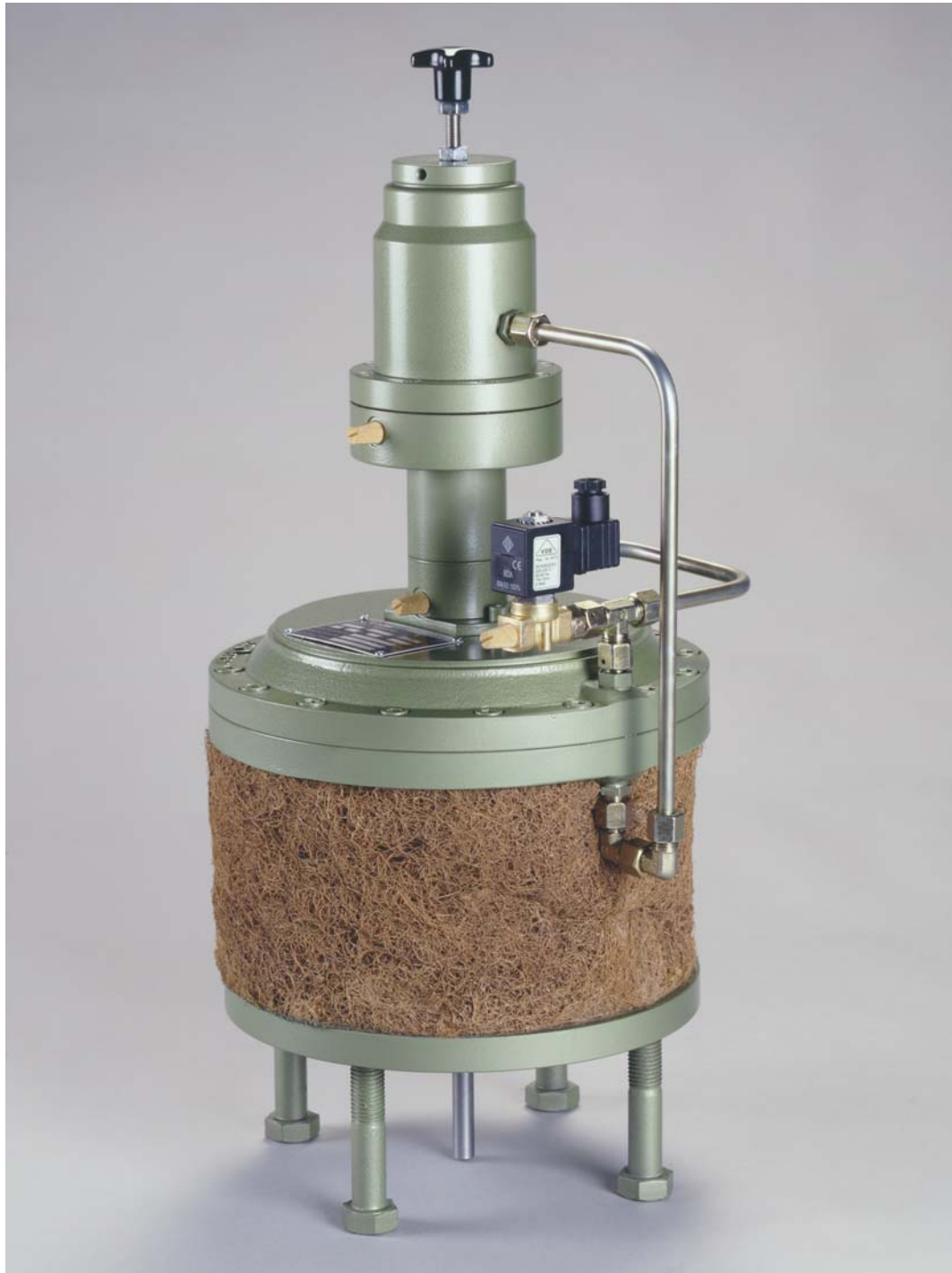
Bild: 1 - Überströmregler Typ 86